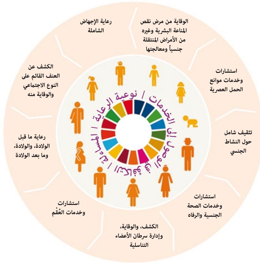
الشكل 4: تأمين رزمة من الخدمات الضرورية الجنسية والإنجابية لليافاعات المتزوجات وغير المتزوجات طوال حياتهن (نهج صندوق الأمم المتحدة للسكان)